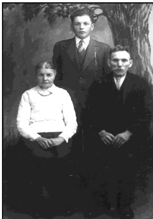
Autor wspomnień (z tyłu) wraz z rodzicami. Fotografia z roku 1945.