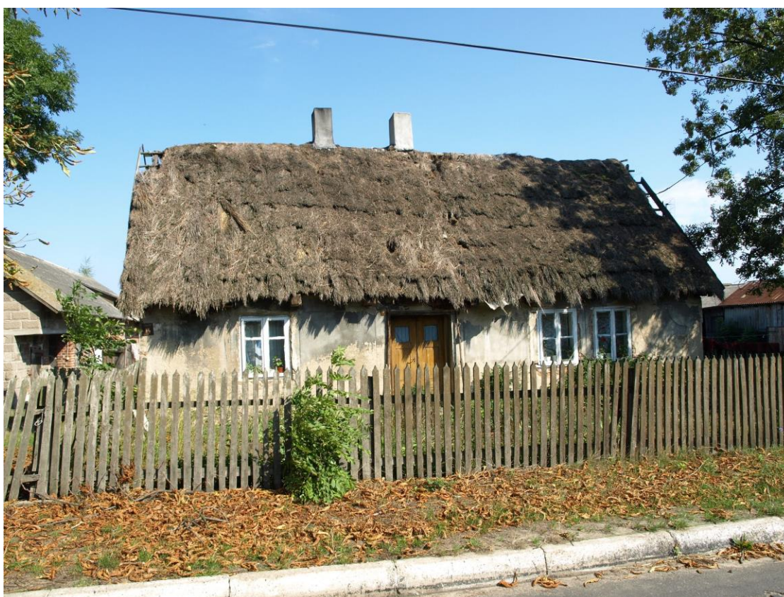
Oryginalna chłopskie chata z czasów istnienia getta. Widok z roku 2006.

czyli, to tatuś by bicie dostał. Niemcy się tak na nim mścili, bo on znał niemiecki i oni chcieli, żeby przepisał się za Niemca. Ale on nie chciał. Długo go tak namawiali. On przed wojną kilka lat pracował w Niemczech, żeby sobie gospodarstwo kupić. Tam też nauczył się języka i mamę poznał. 57 Wspomniany przydział żywności nie był zbyt wysoki. Zgodnie z zarządzeniem Namiestnika Rzeszy z 5 maja 1941 roku dzienna racja dla Polaków była o 1000 kalorii niższa niż dla Niemców. Wiadomo, że „rasa panów” musiała jadać lepiej. W końcu ludność podbita skazana była na wymarcie.