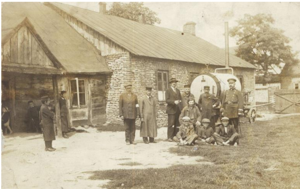
Żydzi w Uniejowie

To jest prawdziwa data powstania getta, które zajmowało teren między ulicami Wąską i Szeroką (zwaną wówczas Żydowską). Tu warto podkreślić, że w swoich pracach Łuczak myli się i podaje inną datę, znacznie późniejszą. Od października tegoż roku zaczęto do niego sprowadzać r również mieszkańców wspomnianego Uniejowa, a także Brudzewa i Władysławowa. Samodzielne pozostawiono jedynie getta w Tuliszkowie oraz w Dobrej. O Tuliszkowie też wiemy nie wiele. W tym mieście pierwsi Żydzi osiedlili się na początku XIX wieku. Wcześniej Żydom nie wolno było w nim zamieszkiwać na stałe. Niedługo po ich przybyciu założony został cmentarz i wzniesiona synagoga. Znajdowała się ona przy ulicy 1 Maja. Z kolei cmentarz zlokalizowany był przy drodze do wsi Krępa. Podczas wojny został on całkowicie zniszczony przez okupantów. Zbudowano również chasydzkie domy modlitwy. Żydzi handlowali zbożem, drewnem i bydłem. Niektórzy parali się także rolnictwem, gdyż posiadali własne gospodarstwa. Podczas powstania styczniowego w 1863 roku