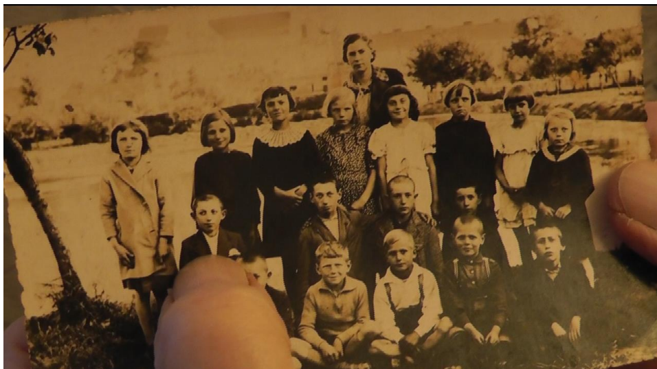
Dzieci żydowskie na fotografii międzywojennej. Drugi rząd 4 chłopców, pierwszy rząd pierwszy od prawej (pseudonim Kusy). Nie udało się ustalić nazwisk dzieci.

Struktura mieszkańców miasta narodowości żydowskiej przed wybuchem wojny była dosyć złożona. Mieszkali w nim: