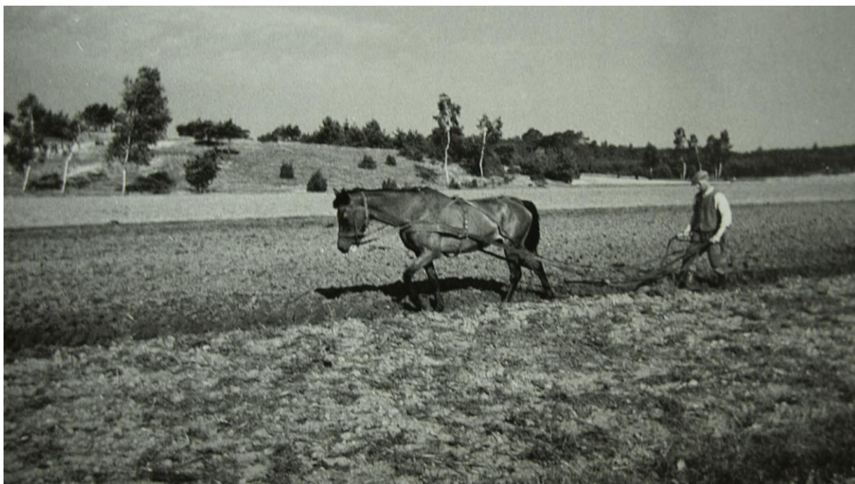
Polski rolnik pracujący na polu

zimy jak teraz! Mróz to był ponad 20 stopnie, a śniegu na chyba na metr napadało! A rok wcześniej to chyba rekord mrozu był, bo było pewnie ze 30 stopni! To wtedy słysząc było, jak od mrozu drzewa pękały! Jak się rano wstało, to zawsze były „kwiatki” na szybach. Lód to się z nich skrobało, żeby światła można było zobaczyć! Wodę to się w wiaderku do domu przynosiło. Wodociągów wtedy nie było. To rano w tym wiadrze to się lud zrobił. Taki mróz był! Najwięcej ściano brzozy, gdyż ta paliła się nawet mokra: Pamiętam, że za domem były takie ładne brzózki. To oni wszystkie przez zimę ścieli. Musieli czymś palić, żeby nie zamarzli. Niemcy nic im nie dali. Myśleli, że sami się z głodu wykończą.