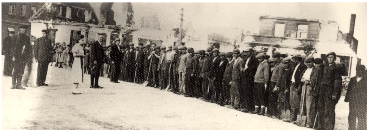
Getto w Uniejowie

Uniejowa pochodzą dopiero z połowy XVIII wieku. Niestety, ale są one bardzo skąpe.