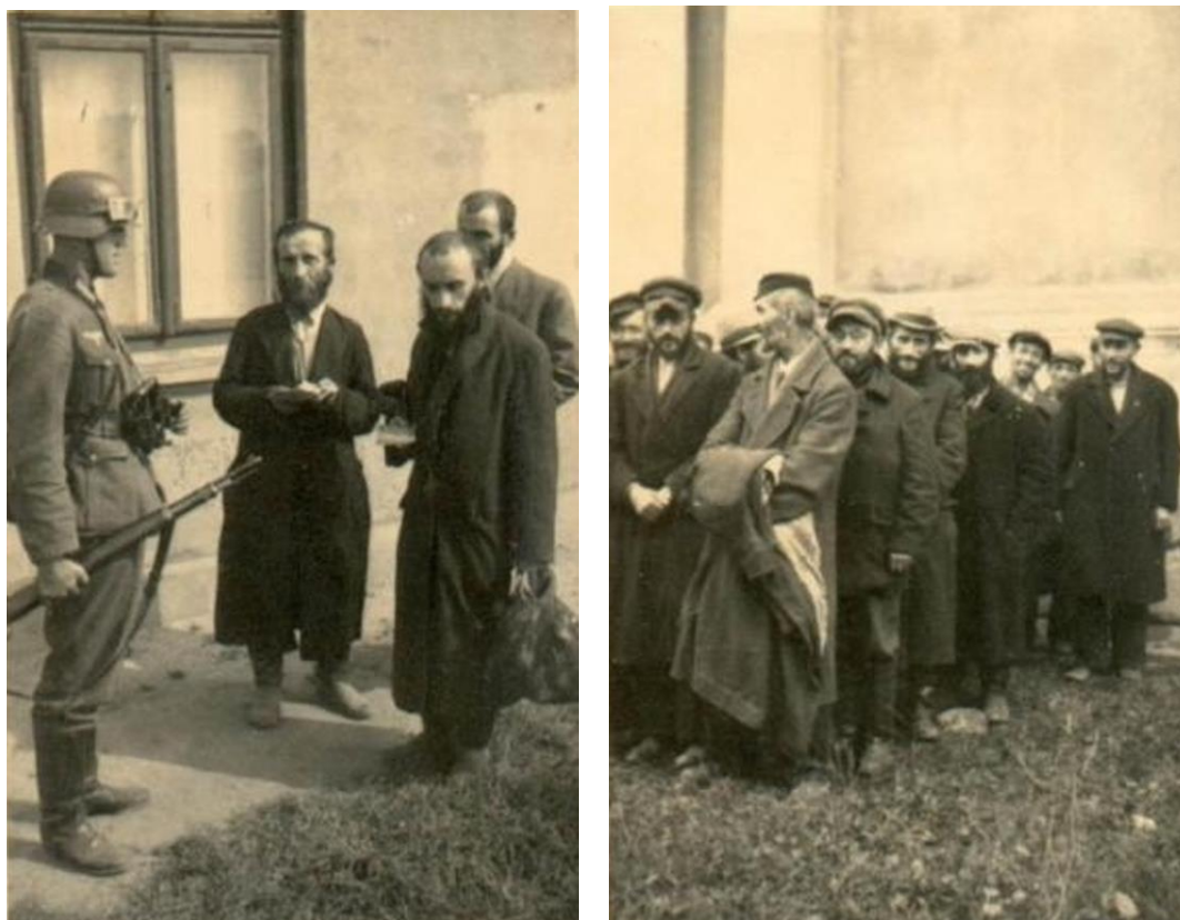
Żydzi w Dobrej podczas okupacji