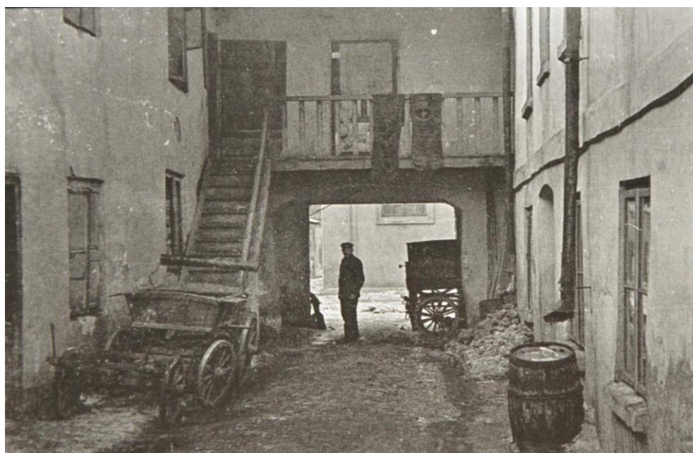
Zabudowania na ul. Wąskiej