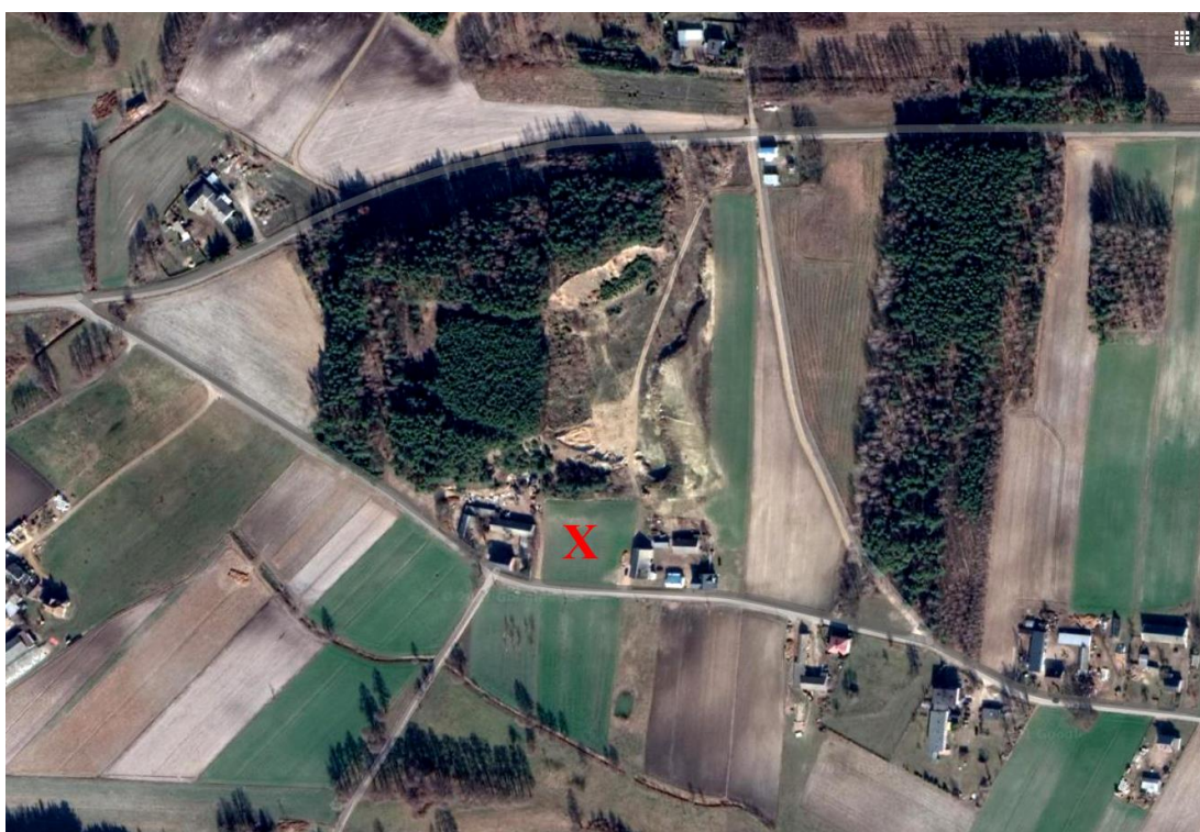
Miejsce egzekucji Żydów zwane „Szubieniczną Górą”

głowach mieli. Kolejne wspomnienia nakładają się: Przyjechała taksówka z 4 Niemcami. To byli Niemcy w czarnych ubiorach. U kogoś były w oborze zamknięte 2 Żydówki. Niemcy wypuścili je z tej obory i kazali iść. Żydówki krzyczały. Wtedy żandarm pociągnął z automatu. Jedna Żydówka to od razu padła, a ta druga to jeszcze żyła i krzyczała i się jeszcze mocno ruszała. To ten żandarm podszedł bliżej i jej pociągnął serię. Niemcy potem zagłądali im w zęby i ręce. Pewnie złota szukali! Potem wsiedli w samochód i odjechali. To była taksówka. Na Kowale pojechali.