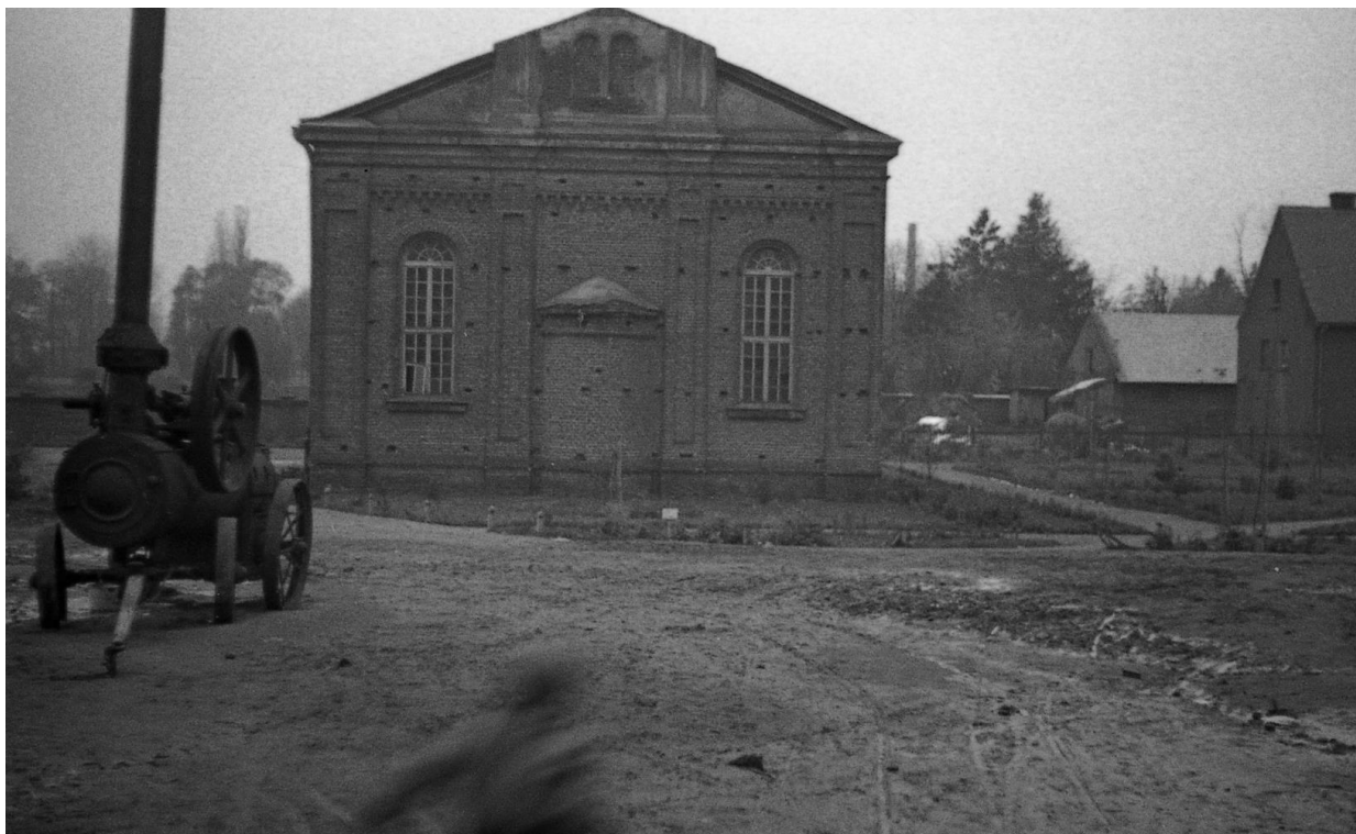
Synagoga w Dobrej

cze bardziej. W roku 1940 Niemcy w ramach restrykcji oraz dalszego szykanowania Żydów z miasta uderzyli w ich religię. Zrobili to z wyrachowaniem oraz jawną złośliwością podważając wielowiekową Tradycję i zwyczaje pogrzebowe.