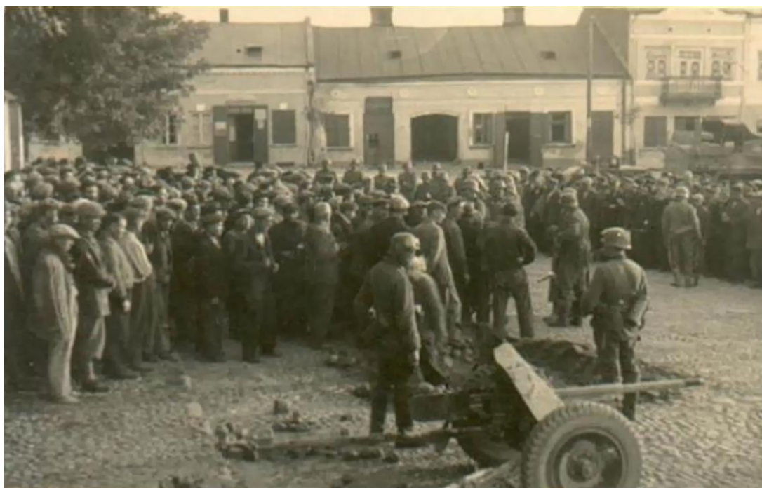
Wojska niemieckie w Dobrej