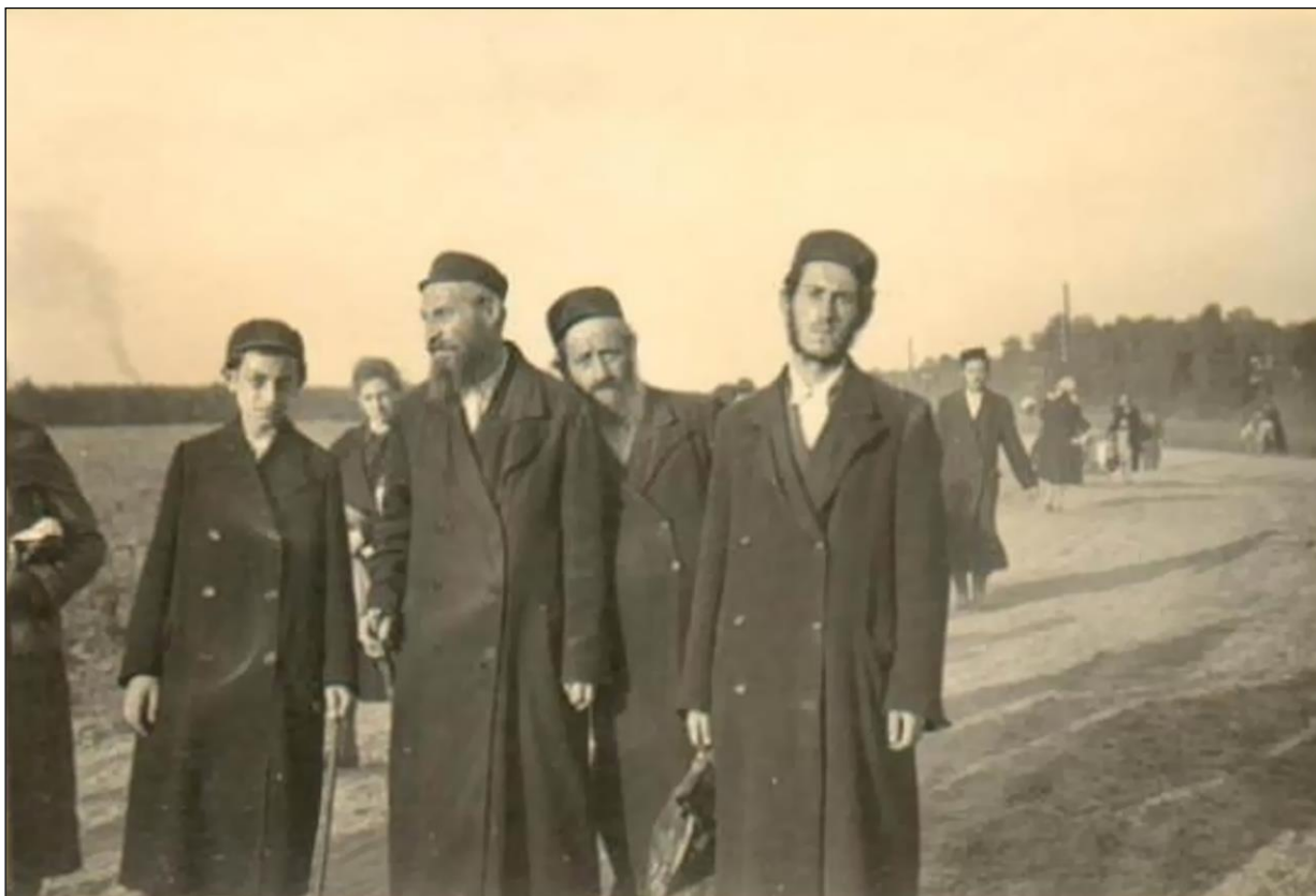
Żydzi w drodze do Dobrej

wspominają tamten grudzień: Kiedy przywieźli Żydów do kościoła, to miałem 9 lat. To z Czachulca ich przywieźli. Mieszkaliśmy w tym samym miejscu, tylko w starym budynku. Tu u nas były 4 rodziny. W każdym pokoju była jedna rodzina. Starzy pod kościół nie chodzili, bo nie było wolno. Ale ja z braćmi to żeśmy podglądali. Ze strychu było wszystko dobrze widać. (...).