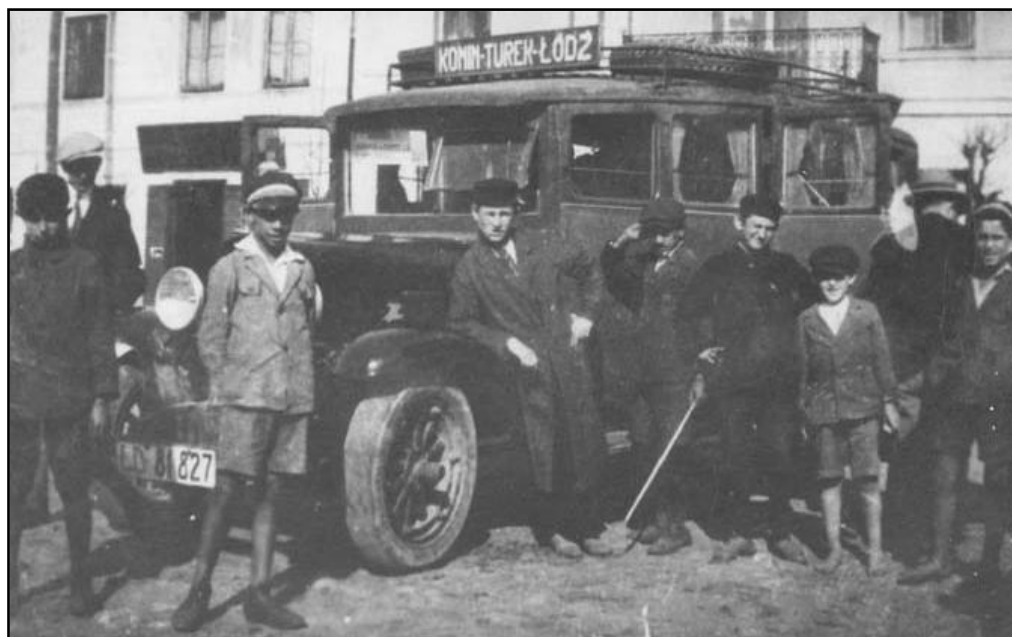
Żydzi z Turku w roku 1939 na przystanku autobusowym w Dobrej w drodze do Łodzi

nazwane zostało „Juden-Kolonie Czachulec”. Wspomniana wieś (pełna nazwa to: Czachulec Nowy) obecnie należy do gminy Kawęczyn. W odróżnieniu od pobliskiego Czachulca Starego była ona zamieszkała jedynie przez obywateli polskich. Nie było tu niemieckich osadników. Żydzi jednak powszechnie posługiwali się nazwą Heidemühle , co można tłumaczyć jako młyn na wrzosowisku . Prawdopodobnie związane jest to z wiatrakiem należącym do Galewskich, który znajdował się na terenie getta między Marcjanowem a Skarżynem. Na piaszczyste wzgórze, na którym był zbudowany do dziś można spotkać wrzosa. W gminie Kowale Pańskie było w okresie międzywojennym bardzo mało Żydów (zaledwie 11). Trudno jednoznacznie powiedzieć, dlaczego wybrano ten teren. Prawdopodobnie przeważały tu względy ekonomiczne, gdyż hitlerowcy czynili wszystko, by koszty eksterminacji zminimalizować.