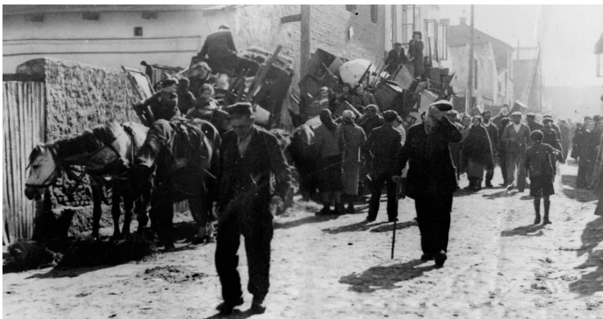
Likwidacja getta w Turku