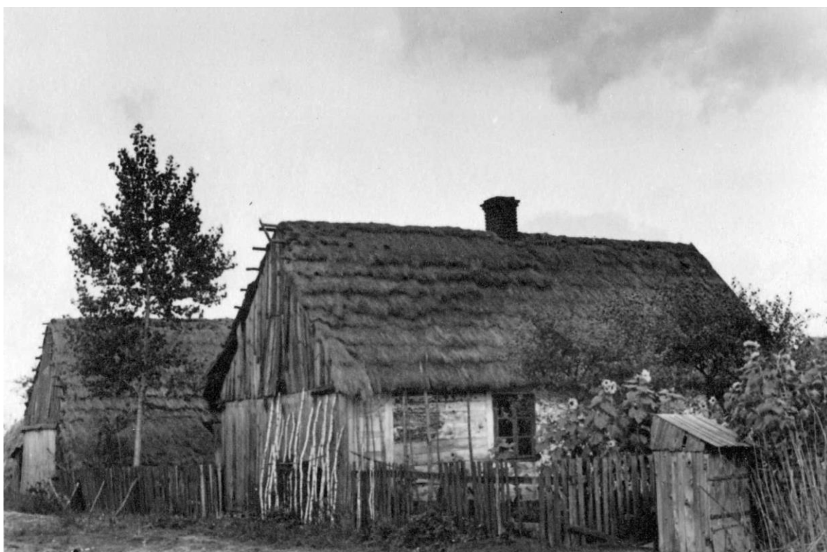
Typowa lepianka szalowana drewnem, zdjęcie z 1939 roku

szych. Przede wszystkim stosowano gliniane klepiska. W ocenie Niemców budynki były bardzo zniszczone. Budynki murowane na tym terenie były rzadkością. Uzupełnieniem zagrody była również gliniana obora oraz drewniana stodoła. Nieodzownym elementem wyposażenia był piec chlebowy. Był on budowany obok domu, z cegły oraz gliny. Paliło się w nim suchym drewnem. Po rozgrzaniu wymiatało się popiół i resztki ognia miotłą najlepiej zrobioną z żarnowca i dopiero wkładało się na łopacie bochny chleba. Można było również po jakimś czasie wkładać brytfannę z ciastem.