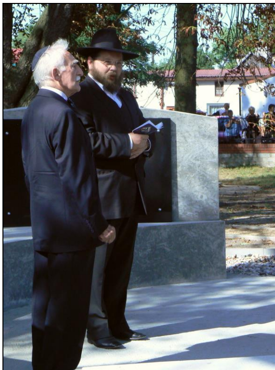
Otwarcie żydowskiego lapidarium na tzw. „starym cmentarzu” w Dobrej

Uważali, że skoro „zabili Pana Jezusa”, to w konsekwencji i tak są skazani na zagładę - nie warto się więc nimi przejmować. Wielu polskich chłopów żerowało na ludzkiej tragedii bogacąc się na pokątnym handlu. Czy jednak można ich do końca potępiać? Trudno odpowiedzieć na tak postawione pytanie. W końcu wielu z nich handlowali żywnością z konieczności, żeby zdobyć deficytowe materiały. Wielu również pomagało bezinteresownie, dzieląc się przysłowiowym „ostatnim bochenkiem chleba” i narażając swoje oraz rodziny. Szewach Weiss nazywa ich „rodzicami”. Mówi: to byli moi Rodzice. Oni dali mi drugie życie. Faktem jest, iż nie brakowało również donosicieli, kolaborantów oraz amatorów „łatwego” zarobku. Ale jest to tragedia całego narodu. W Polsce Żydów denuncjowano powszechnie. Był to proceder tak rozpowszechniony, że na określenie ludzi udzielających za pieniądze informacji o ukrywających się Żydach powstało słowo: „szmalcownik”.