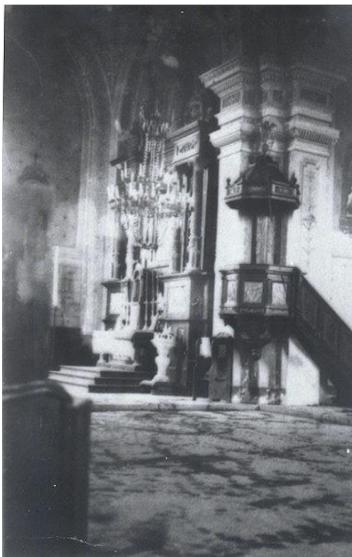
Wnętrze kościoła w Dobrej z okresu przedwojennego