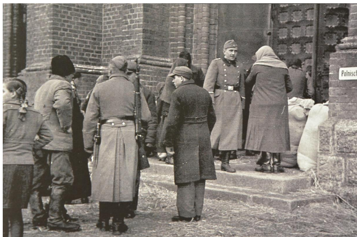
„Czarnomorcy” w tureckim kościele p/w NSPJ