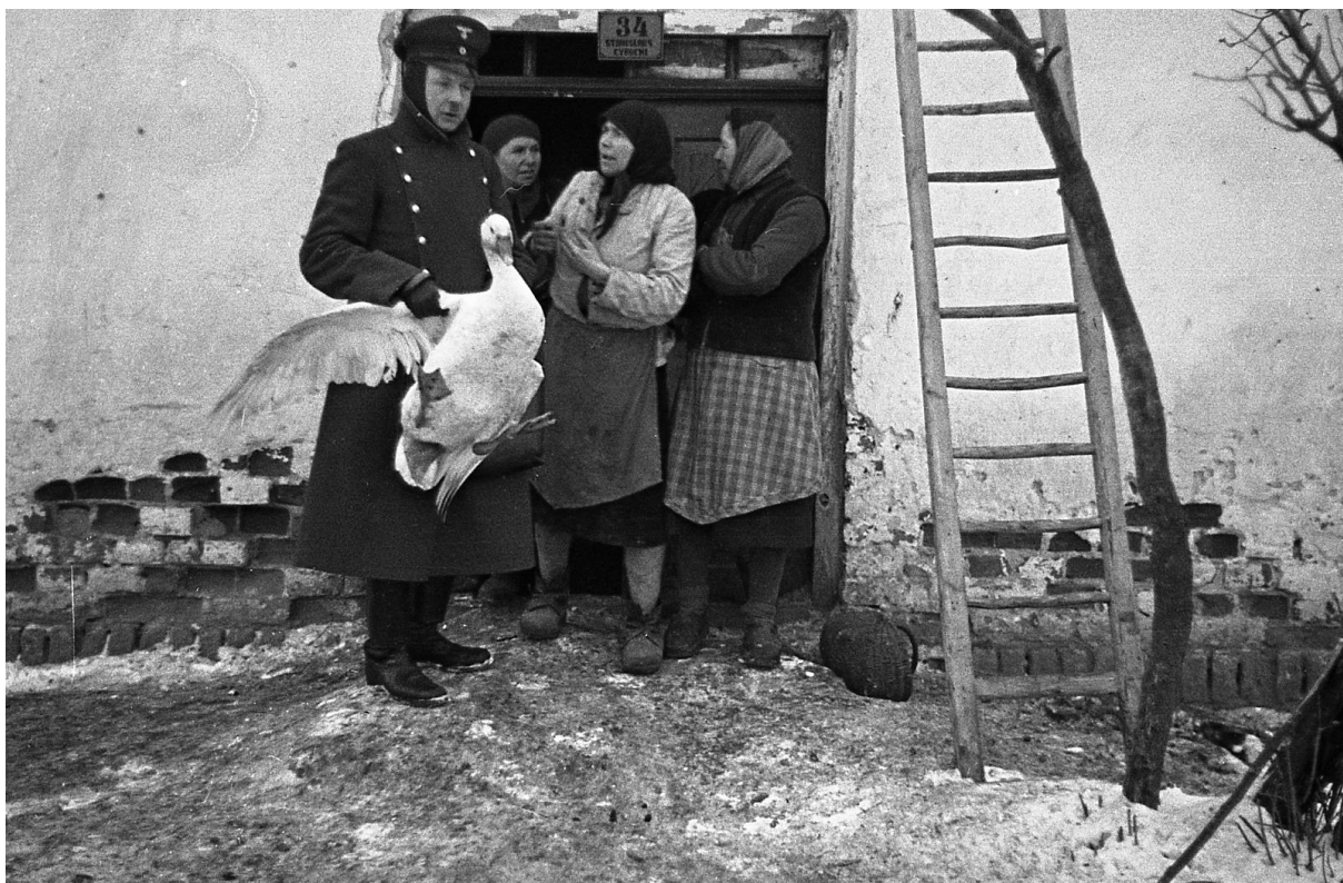
Żołnierz niemiecki rekwirujący drób

nów do drogi do Arenta, Nowy Świat, Pacht, Młodzianów pod Dziewiątkę i Bilawki. Czachulec był już niemiecki... Tam 70% mieszkańców to byli Niemcy. Ja z nimi chodziłem do szkoły. To byli dobrzy ludzie, tylko jak ta wojna nastąpiła, to się zmienili. (...). Żydów przywieźli na jesień. Na wykopki. Żydzi z getta do nas przychodzili i handlowali. I rzeczami, i garnkami, i czym tylko. (...). Co by nie było, to wszystko oddawali za żywność. Przychodziły Żydówki i handlowały.(...).