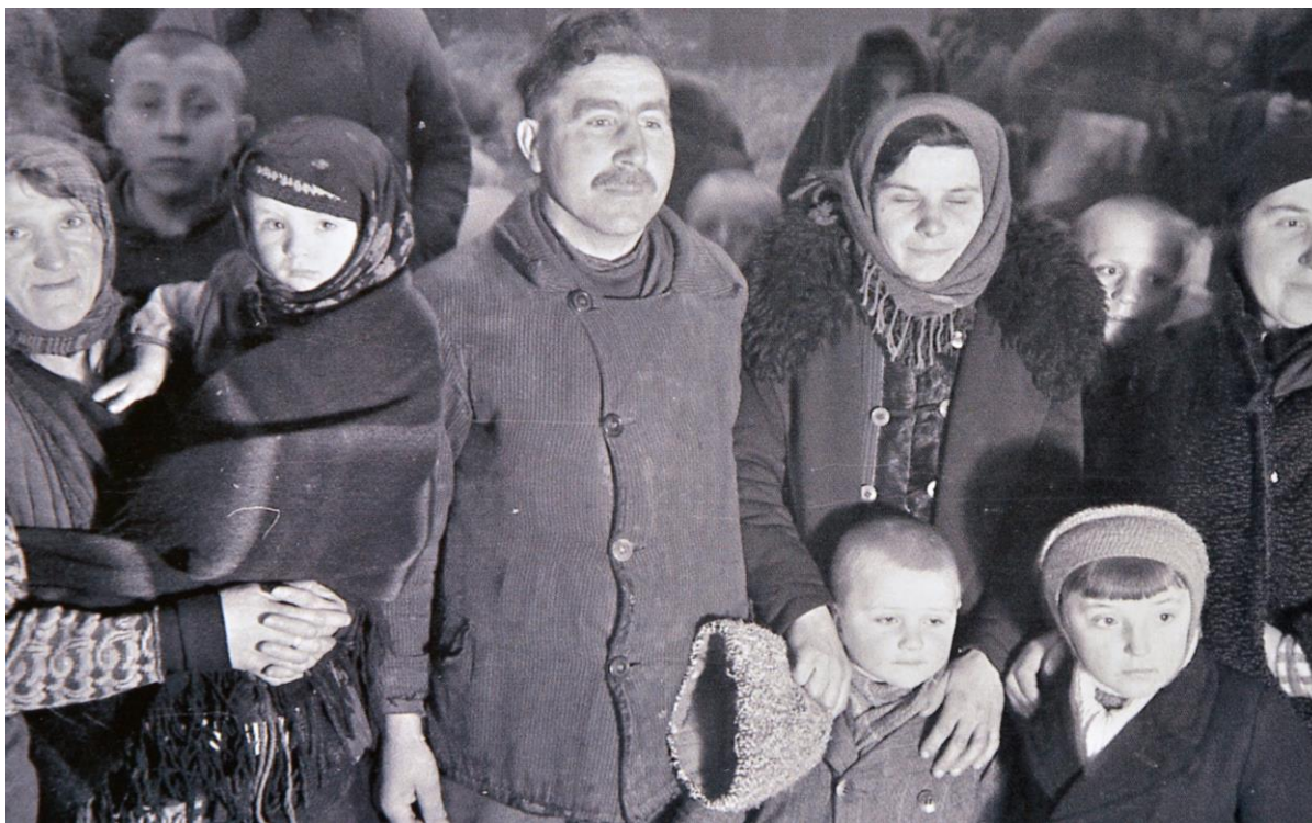
Niemieccy koloniści „Czarnomorcy”