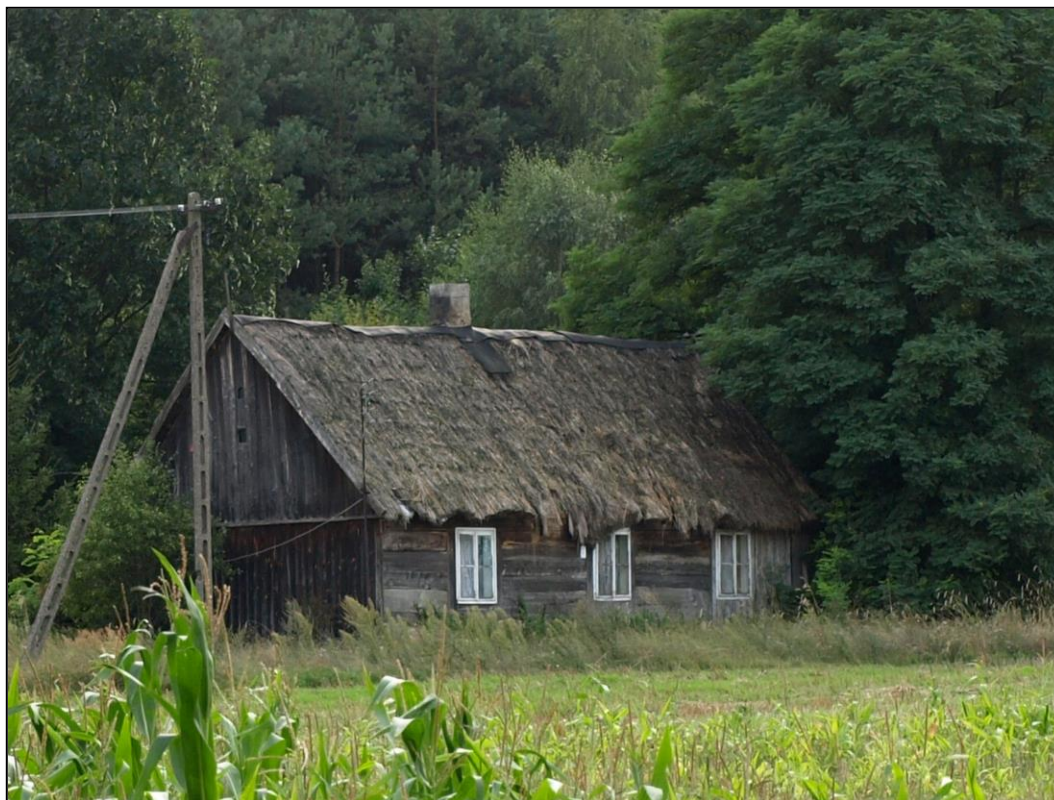
Nieistniejąca już chłopska chata z czasów getta

zapach był inny... Taki świniak to rok czasu rósł - nie to, co teraz... Wojna pogłębiła lokalną biedę. Nie było mowy o legalnym handlu.