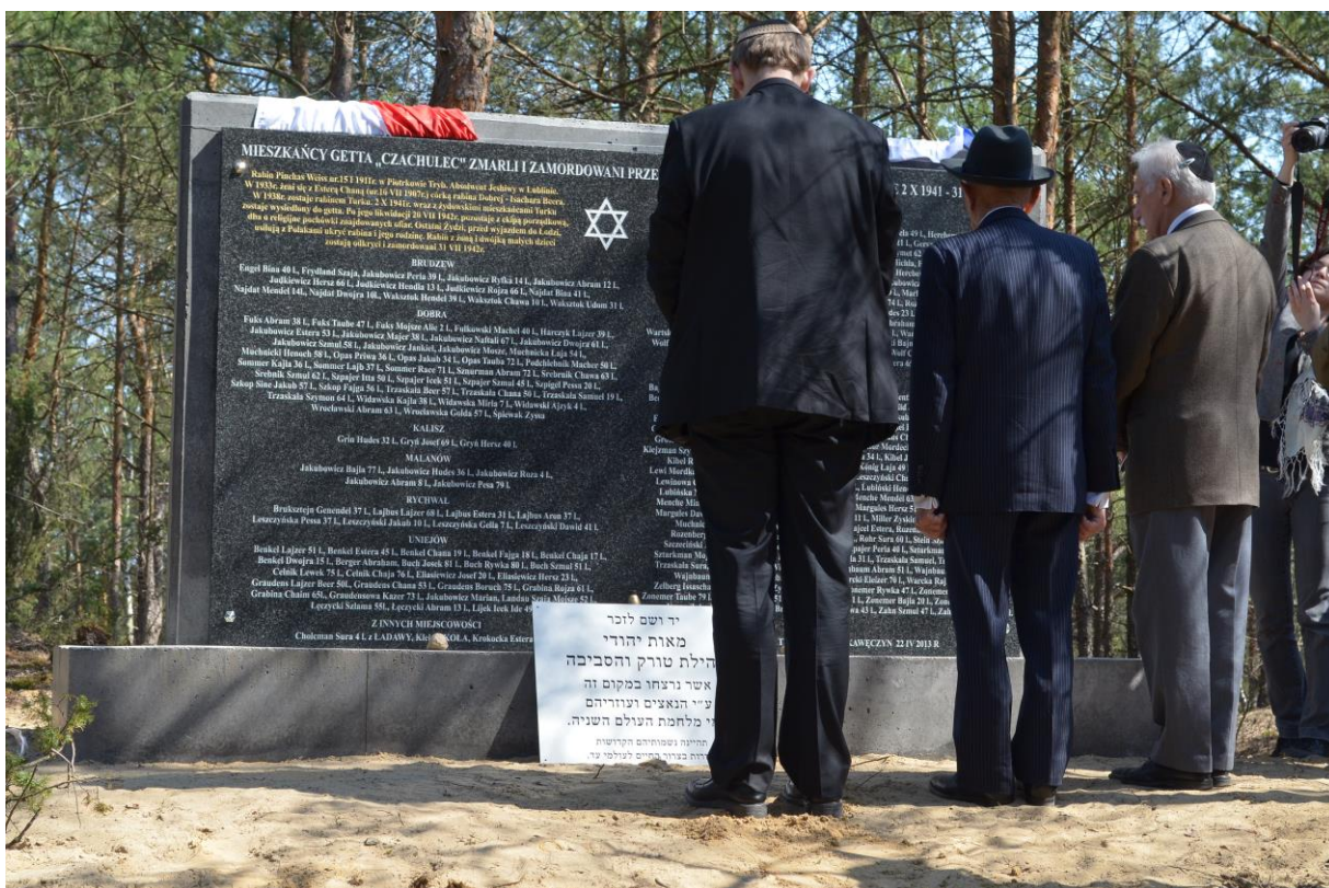
Odświeżenie pamiątkowej tablicy na żydowskim cmentarzu w getcie „Czachulec”, 22 kwietnia 2013