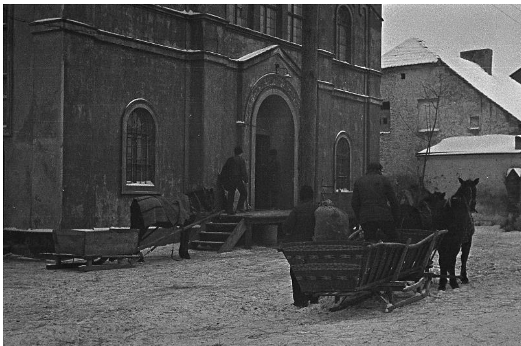
Synagoga w Turku (obecne kino „Tur”)