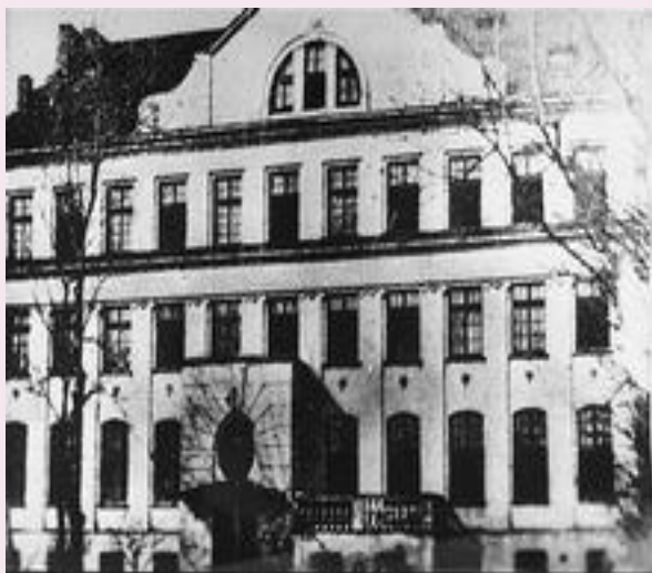
„Dom Sierot”, Warszawa 1935 r.

➔ „Nasz Dom”- zakład opiekuńczy dla dzieci polskich