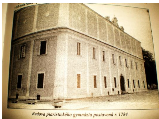
Budova piaristického gymnázia postavená r. 1784