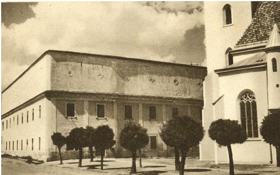
Budova Súkromnej základnej školy v Sabinove

Škola na ktorú zaostri: Budova bývalého piaristického gymnázia v Sabinove, postavená v roku 1784