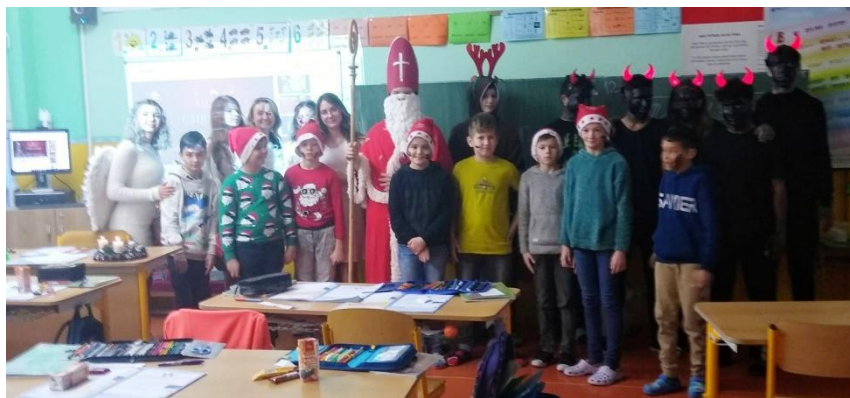
Štvrtáci sú partáci a fotia sa aj s Mikulášom po práci.