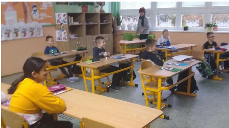
Aj čerti sa zabavili, mazanice vyrobili!!!!