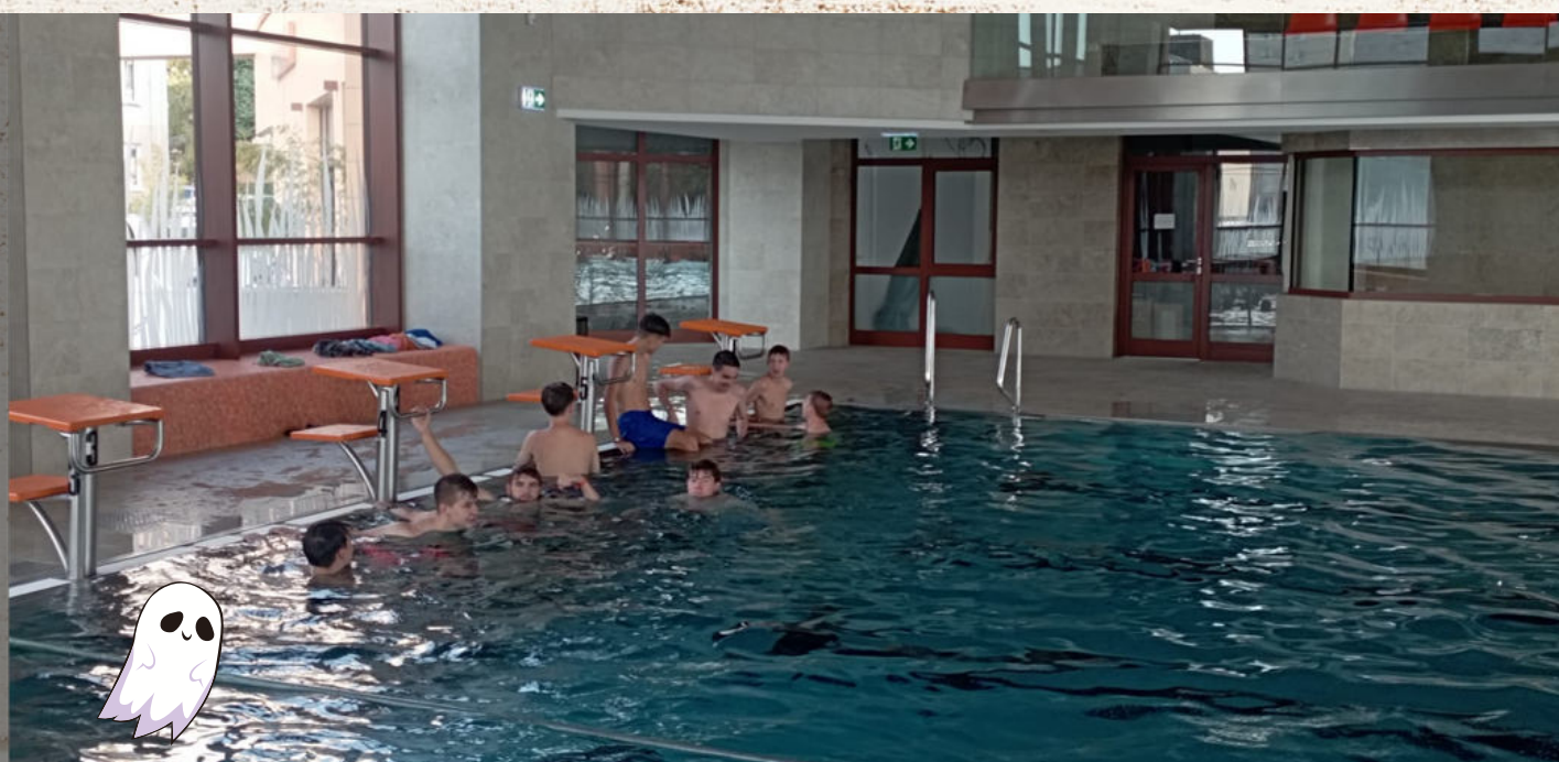
Telesná výchova na plavárni