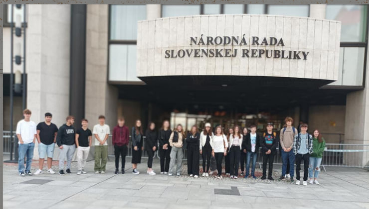
Exkurzia v NR SR