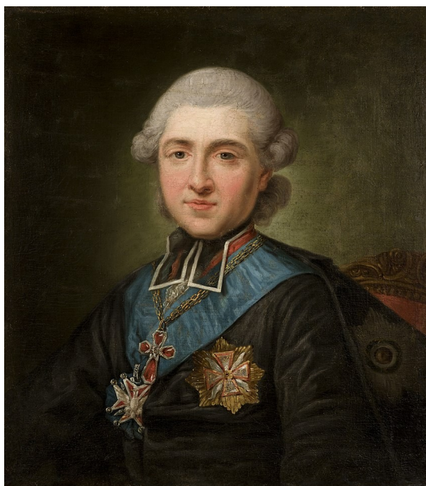
Michał Poniatowski, biskup płocki mal. Marcello Bacciarelli

Potocki Ignacy (1750-1809) , marszałek wielki litewski, działacz polityczny. Wykształcony w Collegium Nobilium i we Włoszech, dzięki małżeństwu z Elżbietą z Lubomirskich wszedł do grona rodziny Czartoryskich i Poniatowskich.