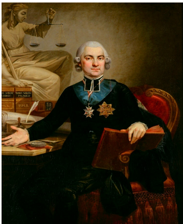
Hugo Kołłątaj, obraz Józefa Peszki